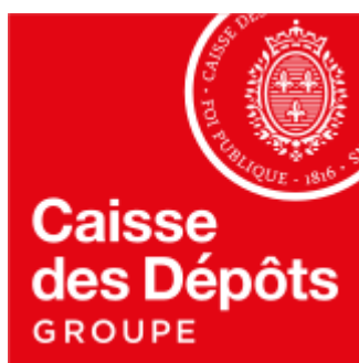
Schéma pluriannuel d'accessibilité 2021 – 2023 Plan annuel 2023